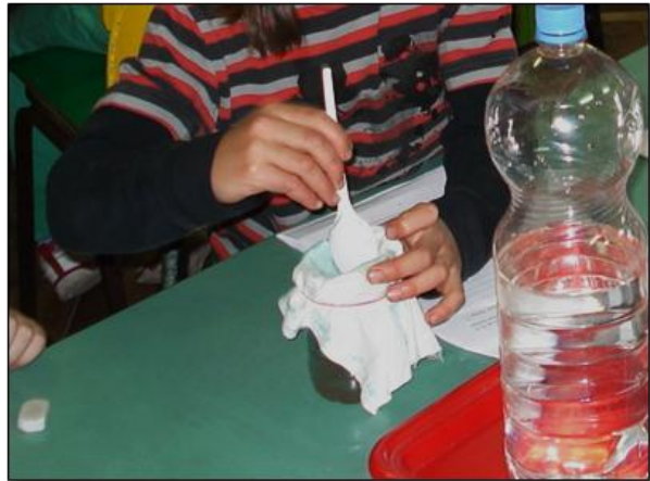
Slika 10: Prečišćavanje vode filtriranjem kroz tkaninu

Postupak filtriranja vode prvo je realizovan pomoću jednostavnih filtera kao što je tkanina i filter papir (Slika 10). Tu su se javili manipulativni problemi postavljanja tkanine na čašu i njenog fiksiranja pomoću gumice, a neiskustvo u postupku filtriranja rezultiralo je zatezanje tkanine preko otvora čaše, umesto da se formira udubljenje u kome bi stajala voda dok se ne procedi u potpunosti. Učenicima nije bilo poznato da se pokretima kašičice po tkanini može ubrzati proces filtriranja.