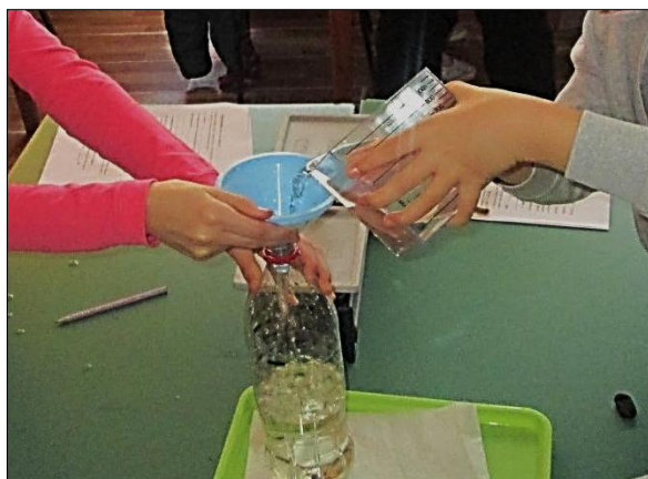
Slika 7: Ogledi za lakše usvajanje mernih jedinica za zapreminu ( \text{dm}^3 , L)

Autori su ogled kruženja vode u prirodi, zbog mera bezbednosti (vrela voda), uradili frontalno. Učenicima su pojedinačni procesi promene agregatnih stanja vode, kao i složeni proces kruženja vode u prirodi, dobro poznati, osim stručnog naziva za prelazak tečnosti (vode) iz gasovitog u tečno agregatno stanje (kondenzacija), koji i nije nužno da usvoje na ovom uzrastu.