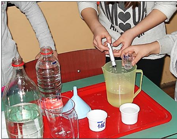
Slika 4: Utvrđivanje odnosa jedinica za merenje tečnosti manjih od litra.

Učenici su sa velikom pažnjom i preciznošću obavljali potrebna merenja (Slika 4). U okviru grupe su korektno sarađivali i uvažavali jedni druge.