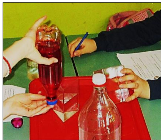
Slika 6: Posmatranje položaja površine tečnosti pri nagnjanju i obrtanju boce.

Tokom izvođenja eksperimenata o horizontalnom (vodoravnom) položaju površine vode uočene su poteškoće mnogih učenika da razlikuju promenu oblika površine tečnosti od promene položaja površine tečnosti (Slika 6). Bilo je potrebno korigovati ogled, odnosno, prisloniti lenjir ili list hartije paralelno sa pravcem površine tečnosti, a potom nagnjati bocu i pratiti da li je list hartije/lenjir i dalje paralelan sa tom površinom. Ovakav pristup pomogao je nekim učenicima da razumeju koncept horizontalnosti površine tečnosti, ali ne svima.