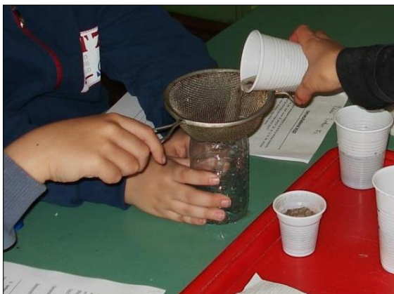
Slika 9: Učenici prečišćavaju vodu ceđenjem

Postupak prečišćavanja vode taloženjem učenici su realizovali tako što su u čaši napravili smešu vode, peska i zemlje, ostavili 10 minuta da miruje i potom proverili da li su se i u kojoj meri čestice nečistoće istaložile na dnu čaše.