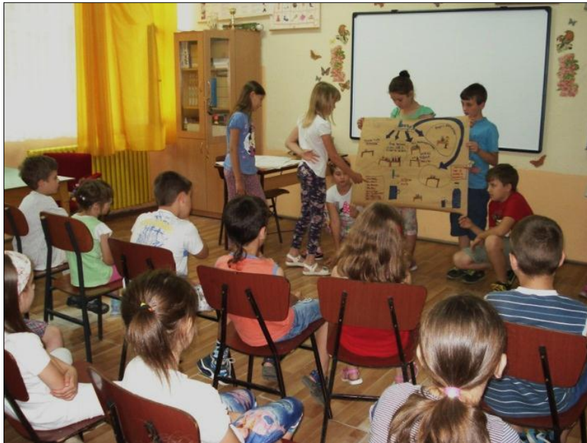
Slika 12: Predstavljanje rezultata projekta učenicima drugog razreda.

Predstavljanje usvojenih znanja i veština vezanih za vodu mlađim drugarima učesnici projekta shvatili su veoma ozbiljno, što i jeste jedan od ciljeva javnog predstavljanja rezultata.