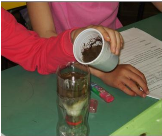
Slika 11: Filtriranje vod kroz samostalno izrađen složeni filter

Drugi istraživački zadatak vezan za filtriranje podrazumevao je pravljenje složenog filtera pomoću plastične flaše, vate, peska i šljunka (Slika 11). Realizovani postupak povezan je sa činjenicom da u prirodi voda prolazi kroz slojeve peska i šljunka koji predstavljaju prirodne filtere. Poteškoće pri realizaciji bile su vezane za logički redosled slojeva u filteru, od sloja koji zadržava najkrupnije čestice (šljunak), preko onoga koji zadržava nečistoće srednje veličine (pesak), do sloja vate koji zadržava najsitnije nečistoće.