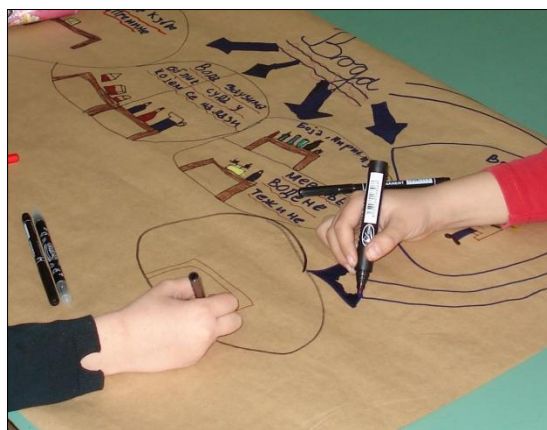
Slika 8: Osmišljavanje postera o osnovnim svojstvima vode

Članovi grupa su na sledećem času pripremili postere o osnovnim svojstvima vode i pomoću njih izvestili drugare o naučenom (Slika 8).